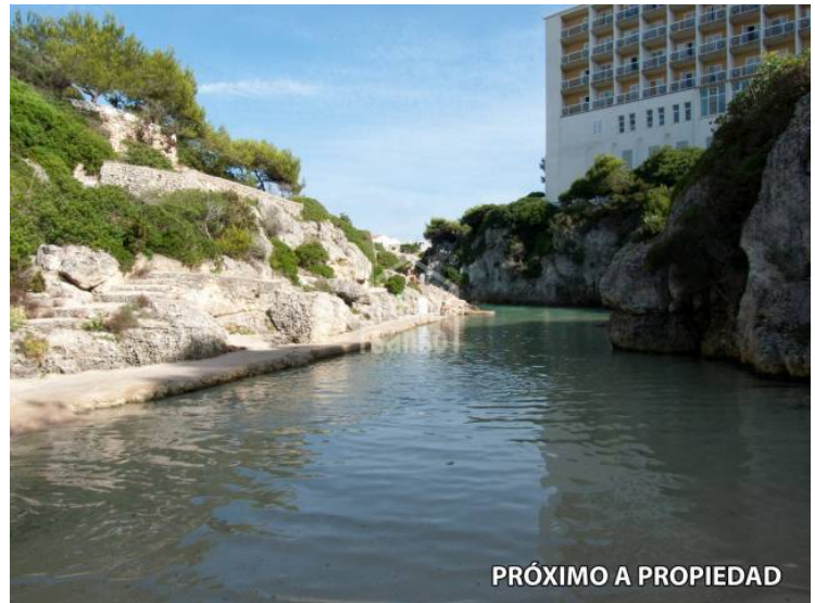
PRÓXIMO A PROPIEDAD