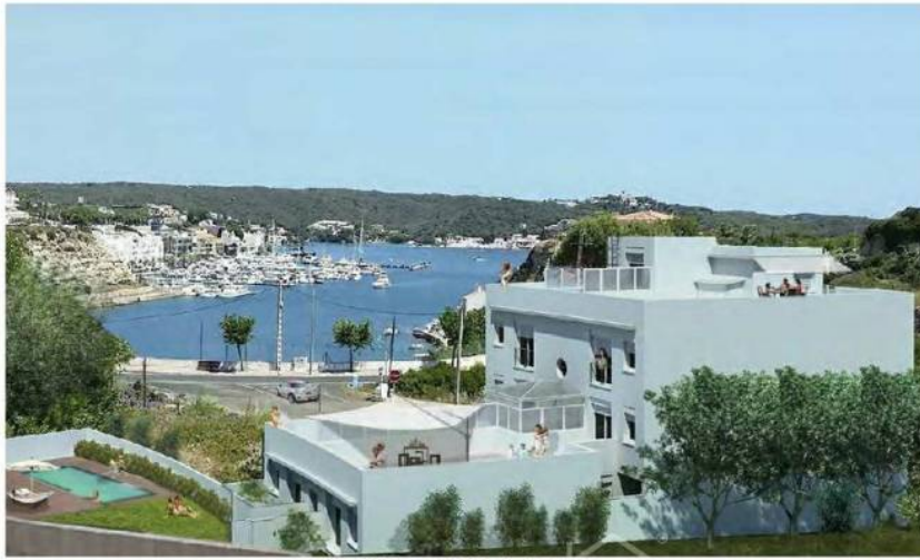
Vista mar desde Sinia des Muret