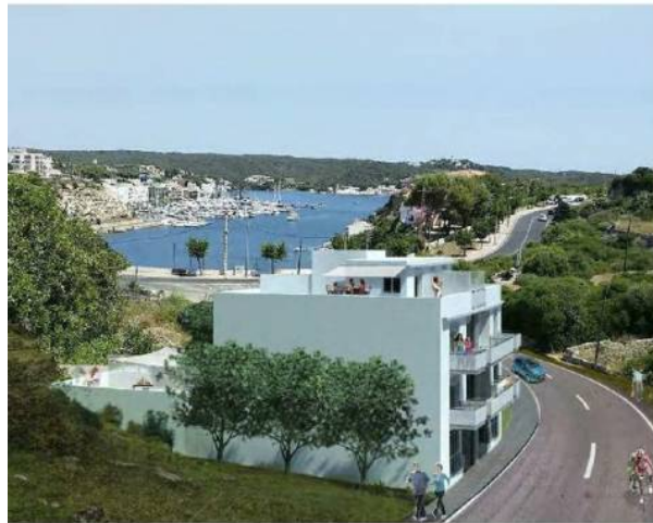
Vista desde Cami Verd