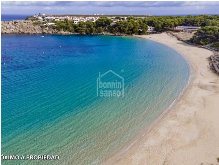
PRÓXIMO A PROPIEDAD

Die dargestellten Informationen werden von Dritten nur zu Informationszwecken angeboten und gelten als Richtig. Die Daten unterliegen Irrtümer, Preisänderung und Rücktritt vom Markt ist ohne vorherige Ankündigung möglich.