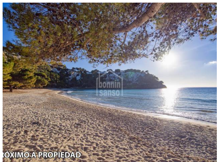
PRÓXIMO A PROPIEDAD

Les informations présentées sont fournies par des tiers à titre indicatif et sont supposées correctes. Les données sont sujettes à des erreurs, changements de prix et retrait sans préavis.