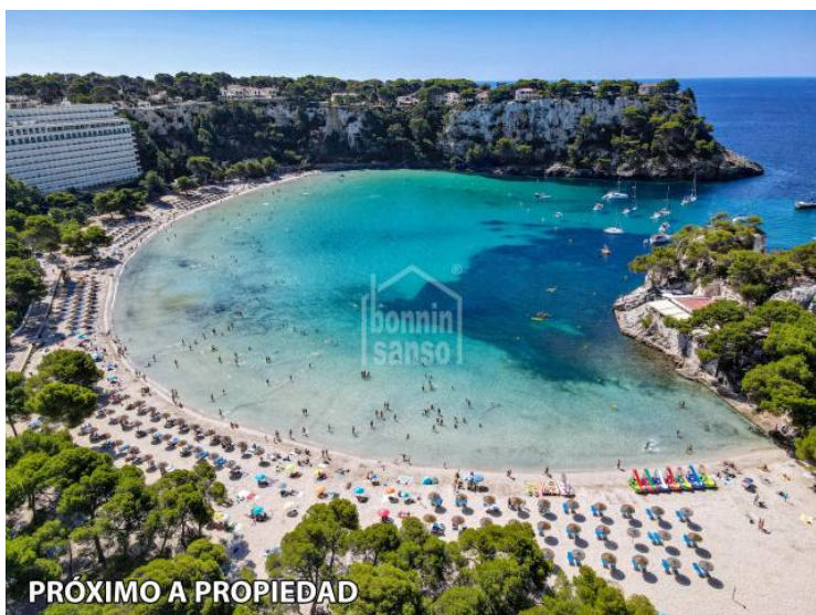
PRÓXIMO A PROPIEDAD