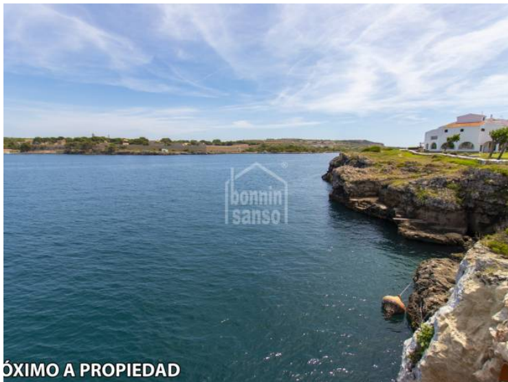
PRÓXIMO A PROPIEDAD