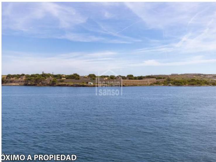
PRÓXIMO A PROPIEDAD