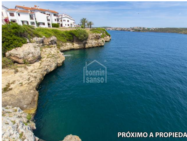
PRÓXIMO A PROPIEDAD